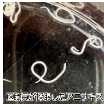
区職員が採取したアニサキス

アニサキスは海洋生物を宿主とする寄生虫で、アジ、サバ、イカ、サケなどを食べることで人に感染します。口から入った本種が胃壁や腸壁に侵入することで激痛や嘔吐など激しい食中毒症状がおこります。