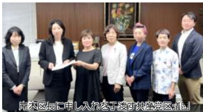
岸本区長に申し入れを手渡す共産党区議団

熱中症は、屋内で罹患することも多く、エアコンの適切な使用が有効な対策となりますが、電気代の高騰でエアコンの使用を控えざるを得ないという世帯や、そもそもエアコンが設置できない世帯も少なくありません。今年も猛暑が