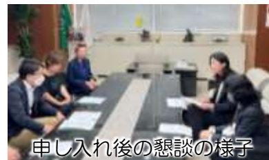
申し入れ後の懇談の様子

予想されることから、区として、低所得世帯等へのエアコン購入費や電気代の補助、区立施設の既存エアコンの老朽化の状況調査を行うことなどを求めました。 応対した区長と環境部長は「非常に重要な指摘と受けとめた。各所管課と連携し、検討していきたい」とこたえました。