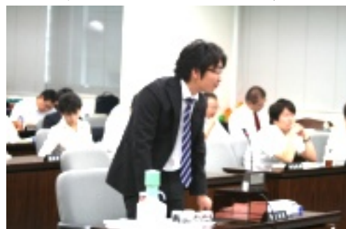
↑後ろには他会派の議員。目の前には区長と部長。

一般質問で区民からの提供情報をもとに区の再測定や除染を約束させましたので、決算特別委員会で、区の線量測定では、区の線量測定のみならず拡充を求めて、論戦を行いました。また、放射線について安心を押し付ける区の姿勢を正し、区民の健康被害を食い止める姿勢をもつよう追及しました。