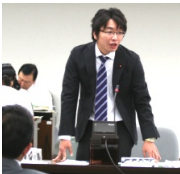
↑決算特別委員会で区政の問題点を追及!