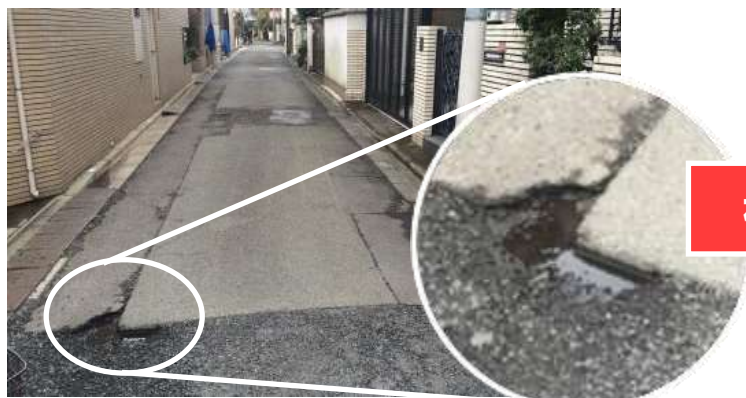
↑アスファルトが剥がれて水が溜まっていました。

1月27日に和泉4丁目で道路の穴を発見しました。古くなったアスファルトが剥がれて危険な状態でしたので、すぐに杉並区の土木管理事務所に補修を交渉し、早期の補修を行ってもらえる事が出来ました。ちょっとした段差でも高齢者や障がい者にとっては大変危険です。今後も安全な街並みの維持に向けて頑張ります。