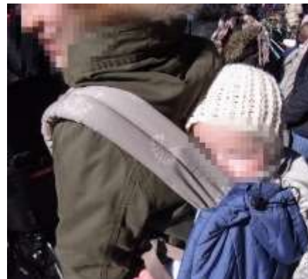
↑「求職活動中だが認可に入れなかった。これでは働けない。」

2013年から一部改善がされたものの、家庭で育児をしつつ求職活動をしている世帯は待機児として数えないなど、未だに現状に則した待機児童数の発表ではありません。