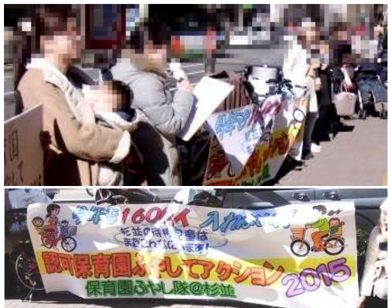
↑ 2月2日の区役所前での抗議行動。