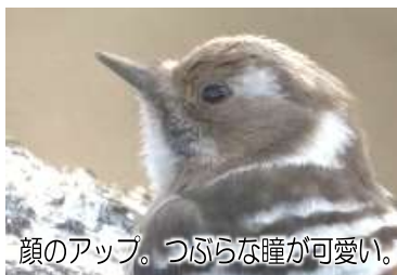
顔のアップ。つぶらな瞳が可愛い。

新緑が茂る直前の時期がコゲラを探す絶好の機会、ココココと木をたたく音が聞こえたら探してみてください。